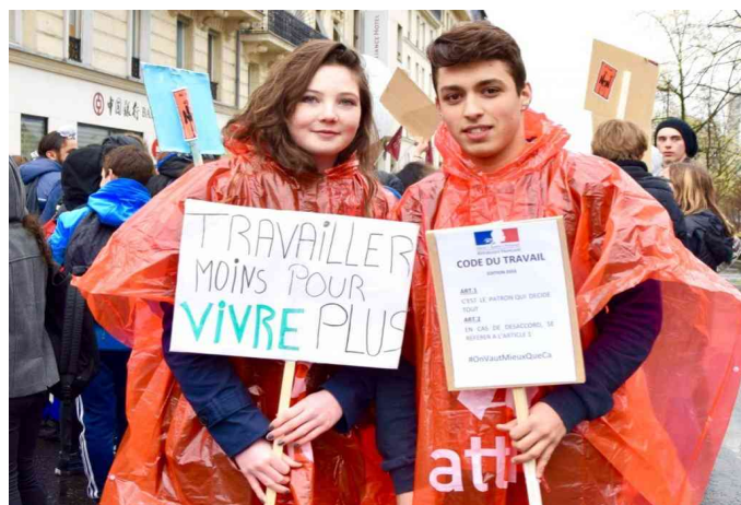
Weniger arbeiten um mehr zu leben!