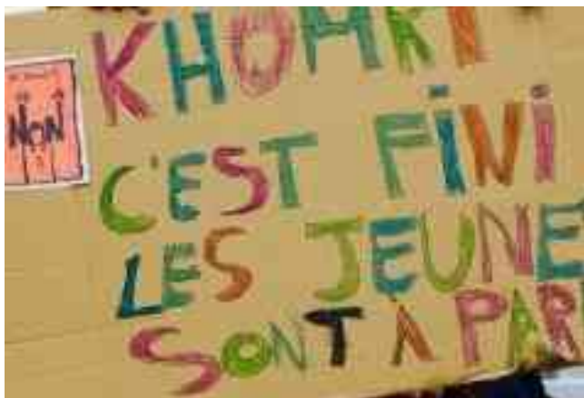
Khomri, jetzt ist Schluss – Die Jugendliche sind in Paris!

Neben einer Lohnerhöhung für die Bergbauarbeiter, einem Verbot von Grubenlampen mit offener Flamme wurden ein Ruhetag gesetzlich verankert und 1910 das Arbeitsgesetzbuch beschlossen. (mdv, Informationen aus dem Artikel in Les Possibles , Newsletter des Wissenschaftlichen Beirats von Attac Frankreich und Wikipedia )