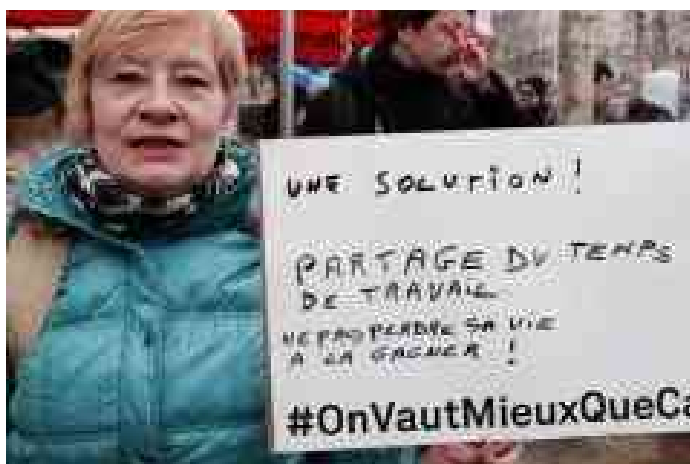
Eine Lösung: Arbeitverteilen