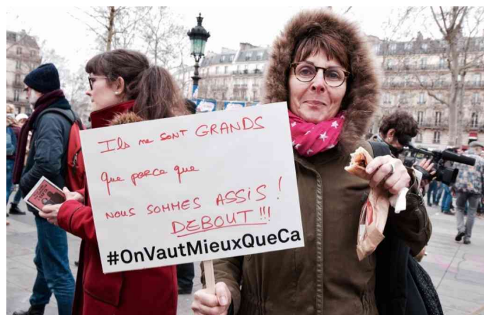
Sie sind nur deshalb groß weil wir sitzen – Aufstehen!