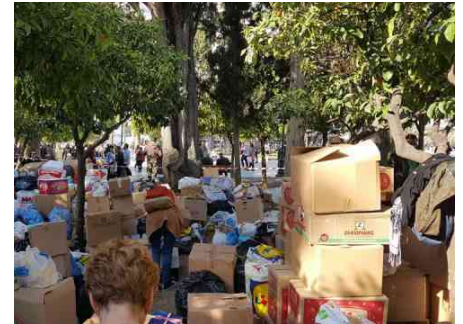
6.3.2016: 10.000 Athener/-innen spendeten für Flüchtlinge.

Monaten mehr als eine Million Menschen gerettet, unterstützt und aufgenommen hat. Im Gesicht der Tausende Freiwilligen aus ganz Europa , die in Lesbos oder Idomeni Menschen helfen. In den Gesichtern von Ada Colau, Bürgermeisterin von Barcelona, und Bodo Ramelow, Ministerpräsident von Thüringen , die freiwillig Geflüchtete aus Griechenland aufnehmen wollen.