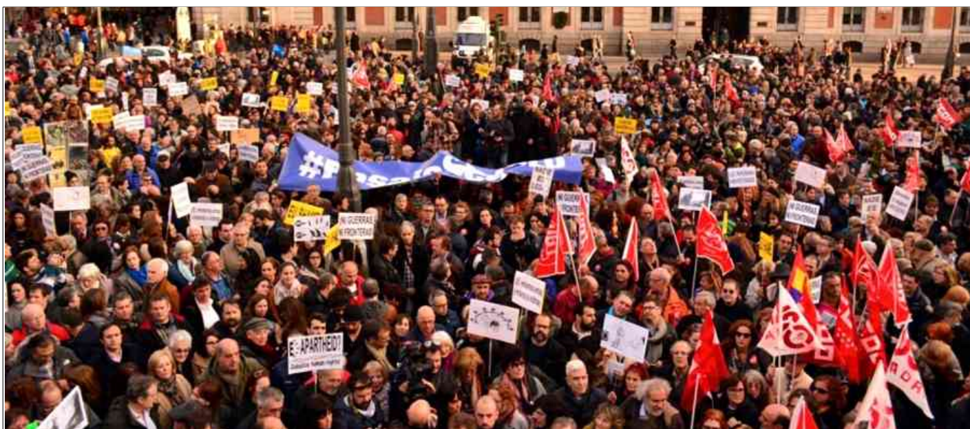
Kundgebung auf der Plaza del Sol am 16. März 2016, Bild: USO

Wenn die Regierungen keine passende Antwort auf diese historischen Herausforderungen haben, haben wir Bürgerinnen und Bürger, Bewegungen und Bündnisse Antworten und wir zeigen sie tagtäglich in unseren Kämpfen auf.