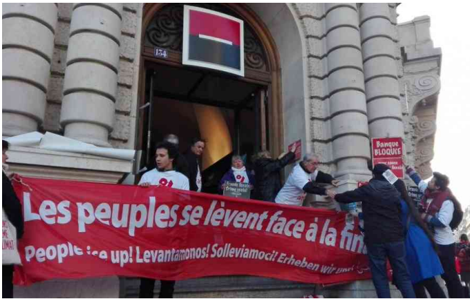
Attac Frankreich Aktion in Paris am 7.4.2016: Blockade der Bank „Société Générale“. Video der Aktion

Die Société Générale hat 136 Filialen in Steueroasen, BNP Paribas 200, Crédit agricole 159. Der französische Staat verliert zwischen 60 und 80 Milliarden jährlich durch die Steuerflucht.