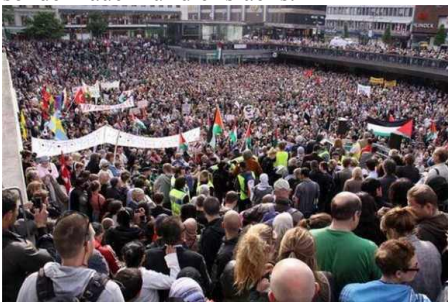
(Schweden, 9. August)

Momentan (am 4. August, dem 100. Jahrestag des Ausbruchs des Ersten Weltkriegs) trauern wir um die fast 2000 Toten und über 6000 Verletzten, die Opfer der Militäroffensive zu Lande, aus der Luft und vom Urlaubs-Mittelmeer her geworden sind. Das sind vor allem palästinensische Opfer. Aber auch die Traumata der Überlebenden und die zerstörten gesellschaftlichen Einrichtungen tragen Konsequenzen – wie es in der Bibel heißt – „bis ins vierte Glied“, und zwar nicht nur auf Palästinensischer Seite, sondern auch für die Israelis.